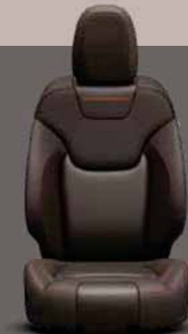
Koyu Kahve/ Kırmızı Dikişli Deri