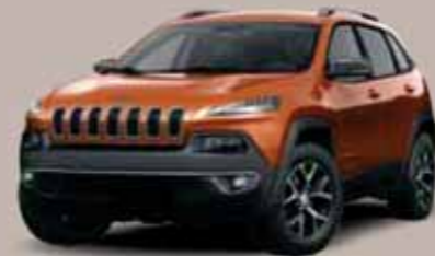
Mango (sadece Trailhawk için)