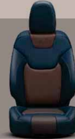
Mavi Gri/Kahve Deri