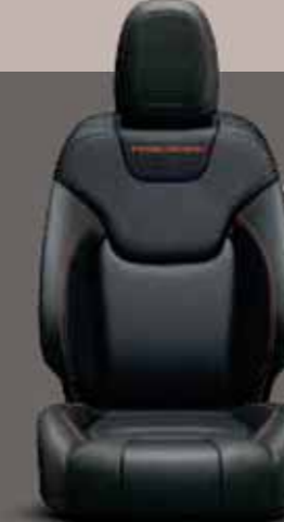
Siyah/Kırmızı Dikişli Deri