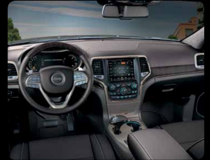
KOYU KAHVE DERİ