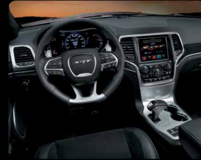
SİYAH SÜET DERİ