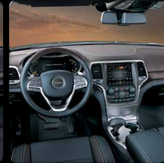
MAVİ GRİ/KAHVE DERİ